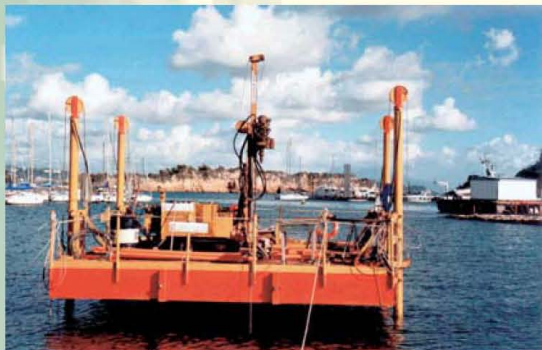
PONTONE JACK UP PER SONDAGGI IN AREE MARINE, LACUSTRI E FLUVIALI INDAGINE ARCHEOSTRATIGRAFICA - GUARDIA DI FINANZA - CAPO MISENO (NA)