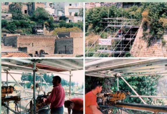
SONDAGGI IN PARETE - SOPRINTENDENZA ARCHEOLOGICA DI POMPEI SCARPATA NORD DEGLI SCAVI DI ERCOLANO (NA)