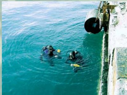
RILIEVI GEOLOGICI SUBACQUEI - AUTORITÀ PORTUALE - NAPOLI