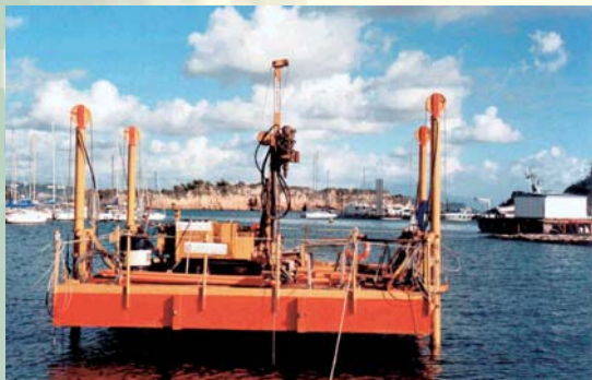
PONTONE JACK UP PER SONDAGGI IN AREE MARINE, LACUSTRI E FLUVIALI INDAGINE ARCHEOSTRATIGRAFICA - GUARDIA DI FINANZA - CAPO MISENO (NA)