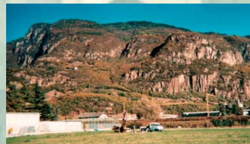
INDAGINI GEOGNOSTICHE PER COSTRUZIONE HANGAR ELICOTTERI GUARDIA DI FINANZA - AEROPORTO DI BOLZANO