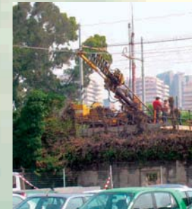
SONDAGGI INCLINATI SU RILEVATO FERROVIARIO CIRCUMVESUVIANA METROPOLITANA DI NAPOLI S.P.A. - NAPOLI