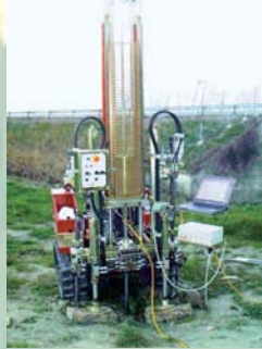
SPEA S.P.A. - C.P.T. PUNTA ELETTRICA AMPLIAMENTO A 3 CORSIE AUTOSTRADA A14 SENIGALLIA (AN)