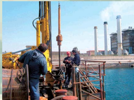
CNR GEOMARE I.A.M.C. - S.P.T. A MARE SU JACK UP PER AMPLIAMENTO DARSENA DI LEVANTE - PORTO DI NAPOLI