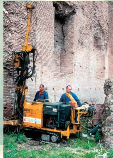
SONDAGGI INCLINATI PER LA VERIFICA STATICA DELLA BASILICA DI MASSENZIO - CISTEC - ROMA