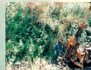
AREA IN DISSESTO IDROGEOLOGICO COMUNE DI NAPOLI - SERVIZIO DIFESA SUOLO - NAPOLI