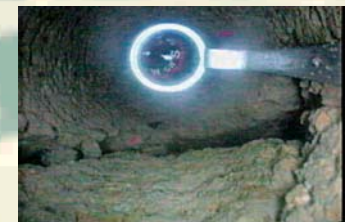
RILIEVO VIDEO STATO DI FRATTURAZIONE IN FORO DI SONDAGGIO