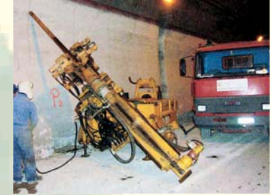
SONDAGGI INCLINATI IN VOLTA - ANAS S.P.A. GALLERIA DI MONTE PERGOLA - BRETELLA AVELLINO - SALERNO