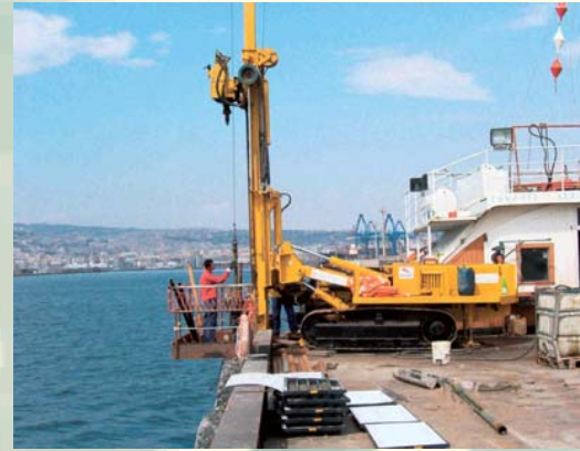
INDAGINI GEOGNOSTICHE A MARE SU JACK UP - ATI ASTALDI / GIUSTINO - AMPLIAMENTO MOLO CALIGOLIANO - POZZUOLI (NA)