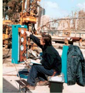
METROPOLITANA DI NAPOLI S.P.A. PROVE PRESSIOMETRICHE - NAPOLI