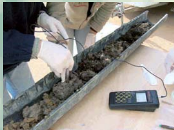
CNR GEOMARE I.A.M.C. - INDAGINI AMBIENTALI DARSENA DI LEVANTE - NAPOLI