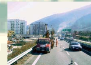
ADEGUAMENTO RETE AUTOSTRADALE SPEA S.P.A. - NOCERA INFERIORE (NA)