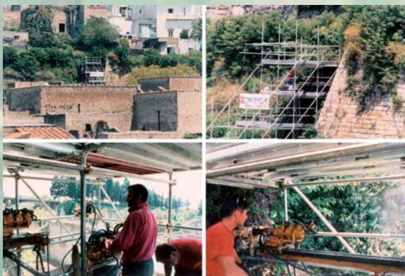
SONDAGGI IN PARETE - SOPRINTENDENZA ARCHEOLOGICA DI POMPEI SCARPATA NORD DEGLI SCAVI DI ERCOLANO (NA)