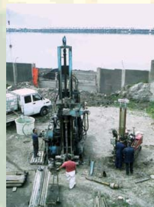
SONDAGGI E PROVE C.T.P. NUOVO PORTO TURISTICO - MARINA DI STABIA S.P.A. CASTELLAMMARE DI STABIA (NA)