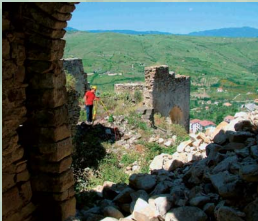
RILIEVO CASTELLO DI LAURENZANA (PZ)