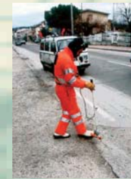
RICERCA E POSIZIONAMENTO SOTTOSERVIZI - TELECOM S.P.A., SALERNO