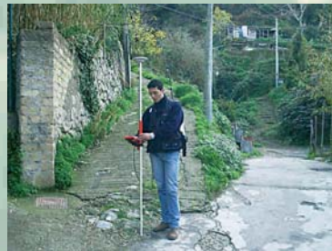
RILIEVO ASSI STRADALI MEDIANTE GPS IN MODALITÀ DINAMICA - ISCHIA (NA)