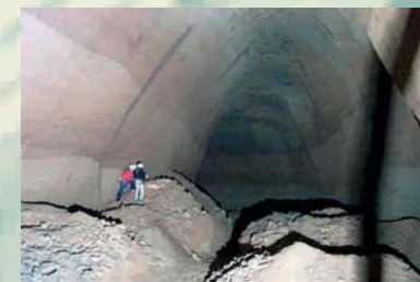
RILIEVO GEOMETRICO, TELEVISIVO E GEOSTRUTTURALE DI CAVITÀ ANTROPICHE - FRULLONE S. ROCCO, NAPOLI COMUNE DI NAPOLI - SERVIZIO DIFESA SUOLO