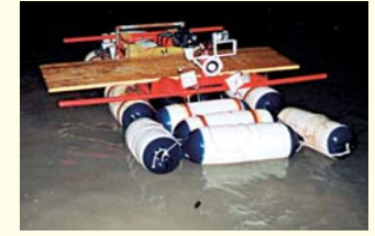
PROVVEDITORATO OO. PP. REGIONE CAMPANIA GALLERIA ACQUEDOTTISTICA "PAVONCELLI BIS" - CAPOSELE (AV)