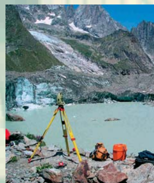
RILIEVO DEL GHIACCIAIO MIAGE ENEL HYDRO S.P.A. - COURMAYEUR (AO)