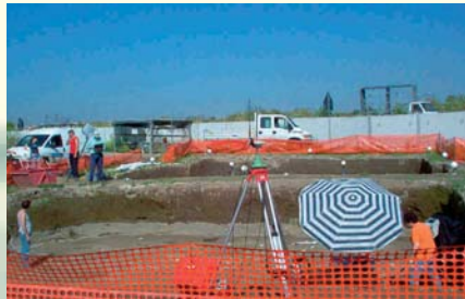
GEOREFERENZIAZIONE DI SCAVO ARCHEOLOGICO MEDIANTE GPS IN MODALITÀ STATICA - TRENO ALTA VELOCITÀ, AFRAGOLA (NA)