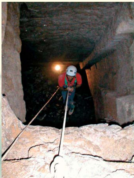
PERSONALE SPELEOLOGICO DURANTE UNA CALATA IN CORDA ALL'INTERNO DI UN POZZO