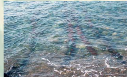
RICERCA E POSIZIONAMENTO PLANIMETRICO CAVI ELETTRICI SOTTOMARINI PIRELLI CAVI S.P.A. - TERNA GRUPPO ENEL - PIOMBINO (LI)