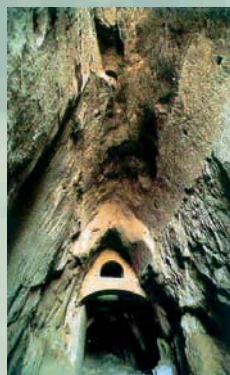
RILIEVO GEOMETRICO, AMBIENTALE E GEOSTRUTTURALE DELLA CRYPTA NEAPOLITANA - NAPOLI SOPRINTENDENZA ARCHEOLOGICA DELLE PROVINCE DI NAPOLI E CASERTA PIEDIGROTTA