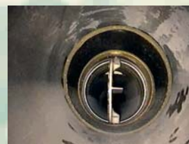
RILIEVO TELEVISIVO DELLA CONDOTTA IDRICA DN 2000 ACQUEDOTTO DEL SERINO (AV) ARIN S.P.A. - SOGESID S.P.A.