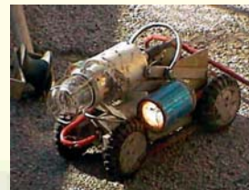
RILIEVO TELEVISIVO FOGNARIO CON TELECAMERA ROBOTIZZATA FIAT S.P.A. - STABILIMENTO DI POMIGLIANO D'ARCO (NA)