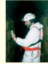
RILIEVO TELEVISIVO COLLETTORE FOGNARIO COMUNE DI NAPOLI UFFICIO FOGNATURE