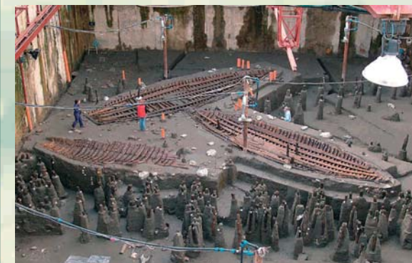
RILIEVO DI DETTAGLIO DEI RELITTI DI IMBARCAZIONI ROMANE - PIAZZA MUNICIPIO, NAPOLI METROPOLITANA DI NAPOLI S.P.A.