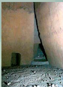
RILIEVO CAVITÀ ANTROPICA RIATTATA A RICOVERO ANTIAEREO PIAZZETTA CARIATI, NAPOLI