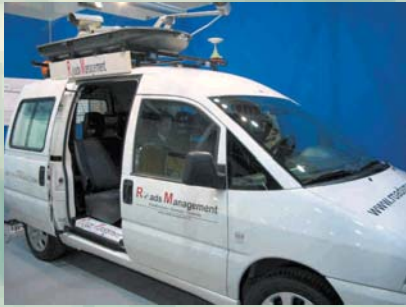
LABORATORIO MOBILE PER RIPRESE STRADALI AD ALTO RENDIMENTO