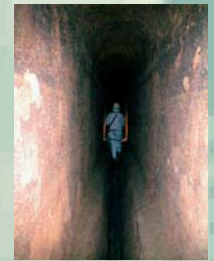
ISPEZIONE CONDOTTO FOGNARIO AD UOMO VIALE KENNEDY, NAPOLI