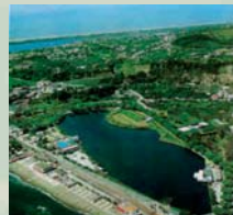
RILIEVO BATIMETRICO E PLANO ALTIMETRICO DEL LAGO DI LUCRINO SOGESID S.P.A. - POZZUOLI (NA)