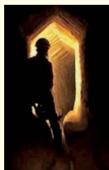
CUNICOLO DELL'ACQUEDOTTO ROMANO DELLA BOLLA PIAZZETTA NILO, NAPOLI