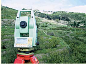
RILIEVO PLANO ALTIMETRICO STRADALE CON STAZIONE TOPOGRAFICA TOTALE SERVOASSISTITA CON LASER INTEGRATO - NEMOLI (PZ)