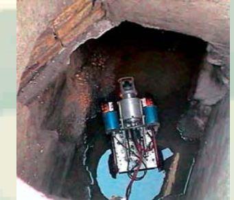
RILIEVO TELEVISIVO FOGNARIO ROBOTIZZATO MONTORO INFERIORE (AV)