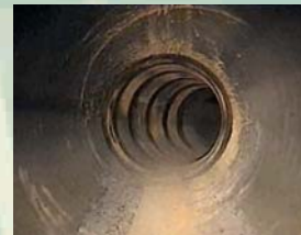
RILIEVO TELEVISIVO DELLA CONDOTTA IDRICA DN 2000 ACQUEDOTTO DEL SERINO (AV) ARIN S.P.A. - SOGESID S.P.A.